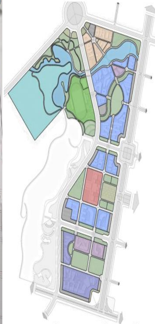
PHƯƠNG ÁN QUY HOẠCH SỬ DỤNG ĐẤT