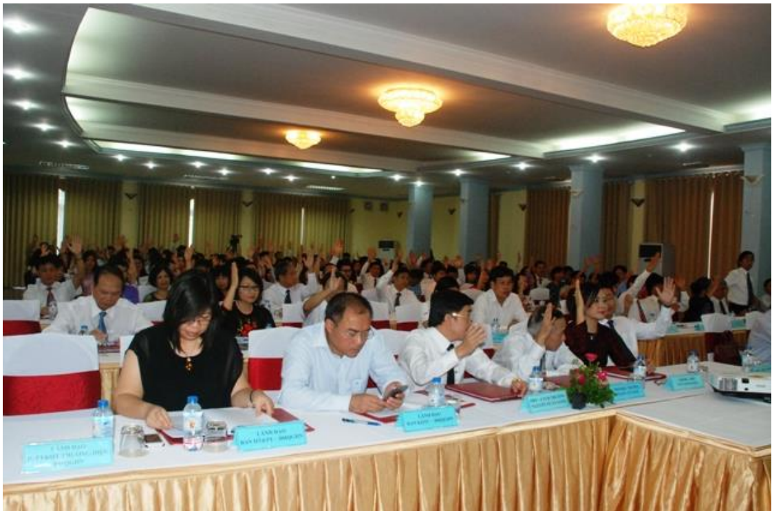
Sự thống nhất ý chí của các đại biểu tham dự Hội nghị đại biểu cán bộ công chức Trường năm 2016-2017