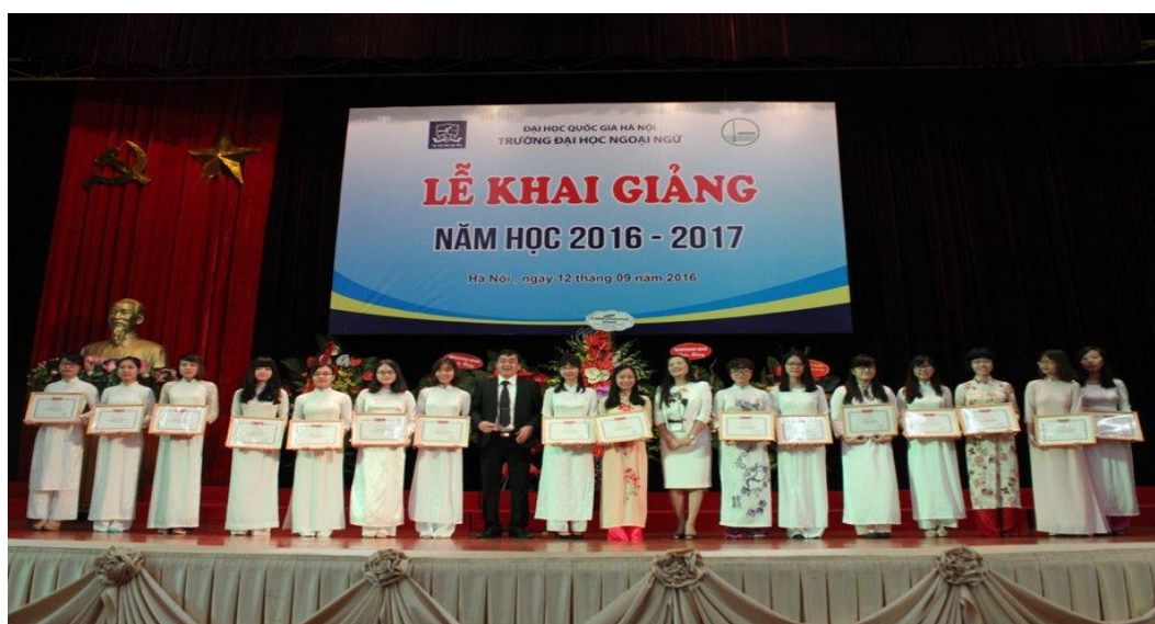
Đại diện sinh viên xuất sắc nhận khen thưởng

Trong năm học 2016 – 2017, Nhà trường tiếp tục thực hiện điều chỉnh chương trình đào tạo theo hướng mở và tích cực mở rộng các chương trình đào tạo liên kết với các trường đại học trong nước và quốc tế. Đây là năm thứ 5 Trường Đại học Ngoại ngữ thực hiện chương trình đào tạo đã được điều chỉnh với những thay đổi quan trọng về Phương pháp giáo dục và kiểm tra đánh giá.