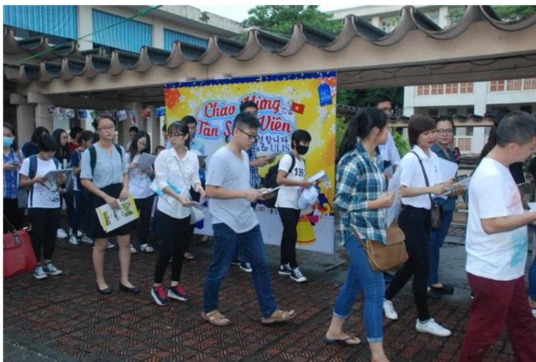
Tân Sinh viên QH2016 làm thủ tục nhập trường

Sau khi hoàn thành thủ tục nhập học, các em được gặp mặt tại các Khoa đào tạo, được đăng ký tham gia kỳ thi tuyển vào các lớp đào tạo Chất lượng cao, tham gia “Tuần sinh hoạt công dân sinh viên” của năm học mới 2016 -2017.