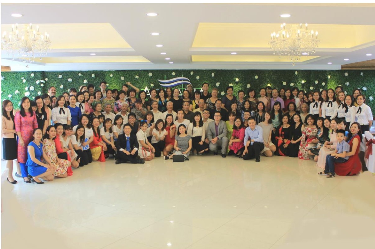
Các thế hệ giảng viên Khoa Sư phạm tiếng Anh

Tiền thân của Khoa Sư phạm tiếng Anh là phân Khoa Anh Văn được thành lập vào năm 1958, một trong những khoa đào tạo tiếng Anh lâu đời nhất ở Việt Nam. Từ khoá đầu tiên chỉ có 04 giảng viên và 09 sinh viên, nay Khoa đã có hơn 130 giảng viên và đào tạo hơn 2.000 sinh viên mỗi năm.