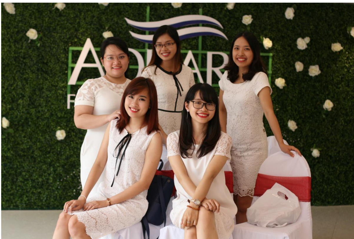
Đội ngũ giảng viên nhiệt tình là một niềm tự hào của Khoa Sư phạm tiếng Anh