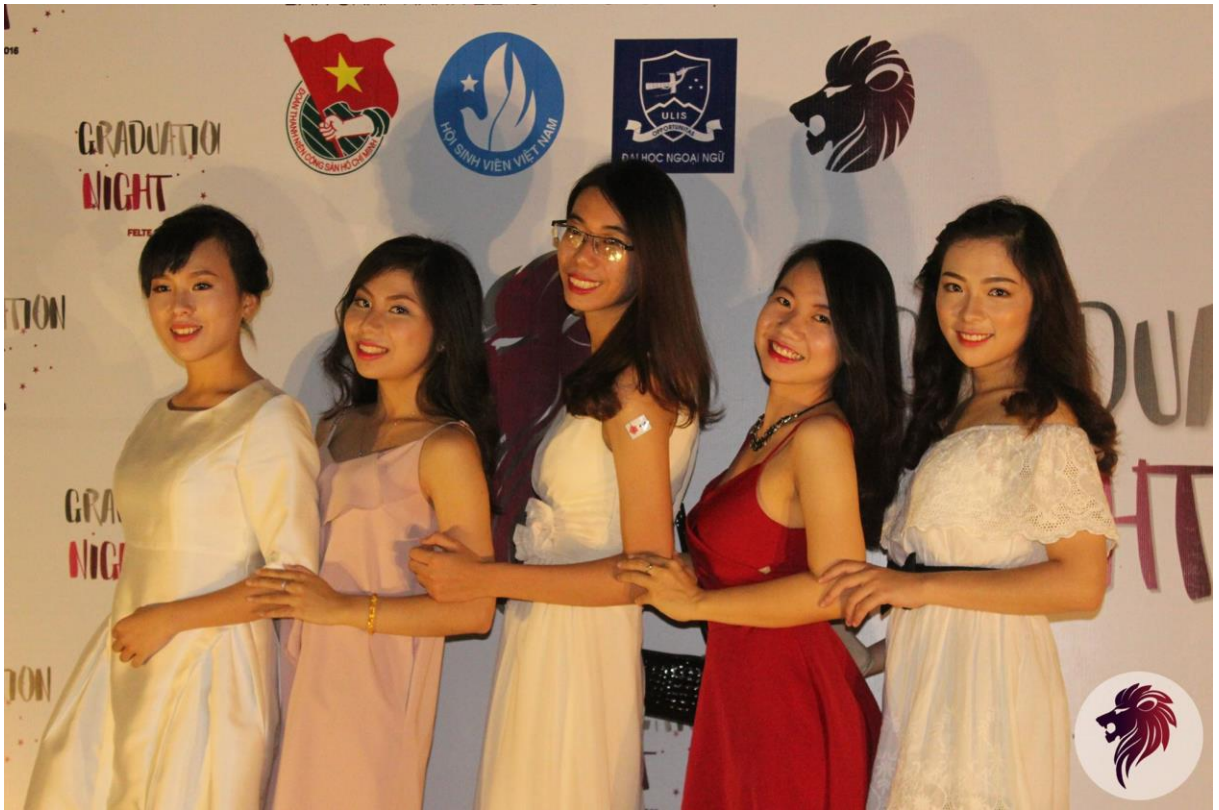
Graduation Night (Lễ hội tốt nghiệp)