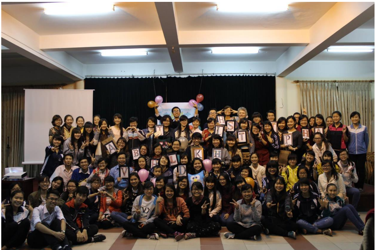
Khoa Sư phạm tiếng Anh luôn tổ chức rất nhiều hoạt động dành cho các bạn sinh viên năng động thể hiện mình.