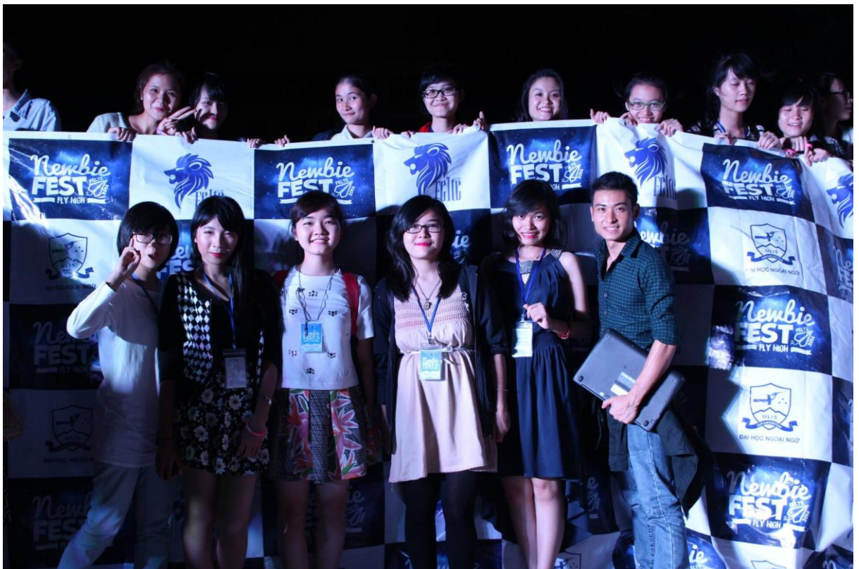
Newbie festival (Lễ hội chào đón tân sinh viên)