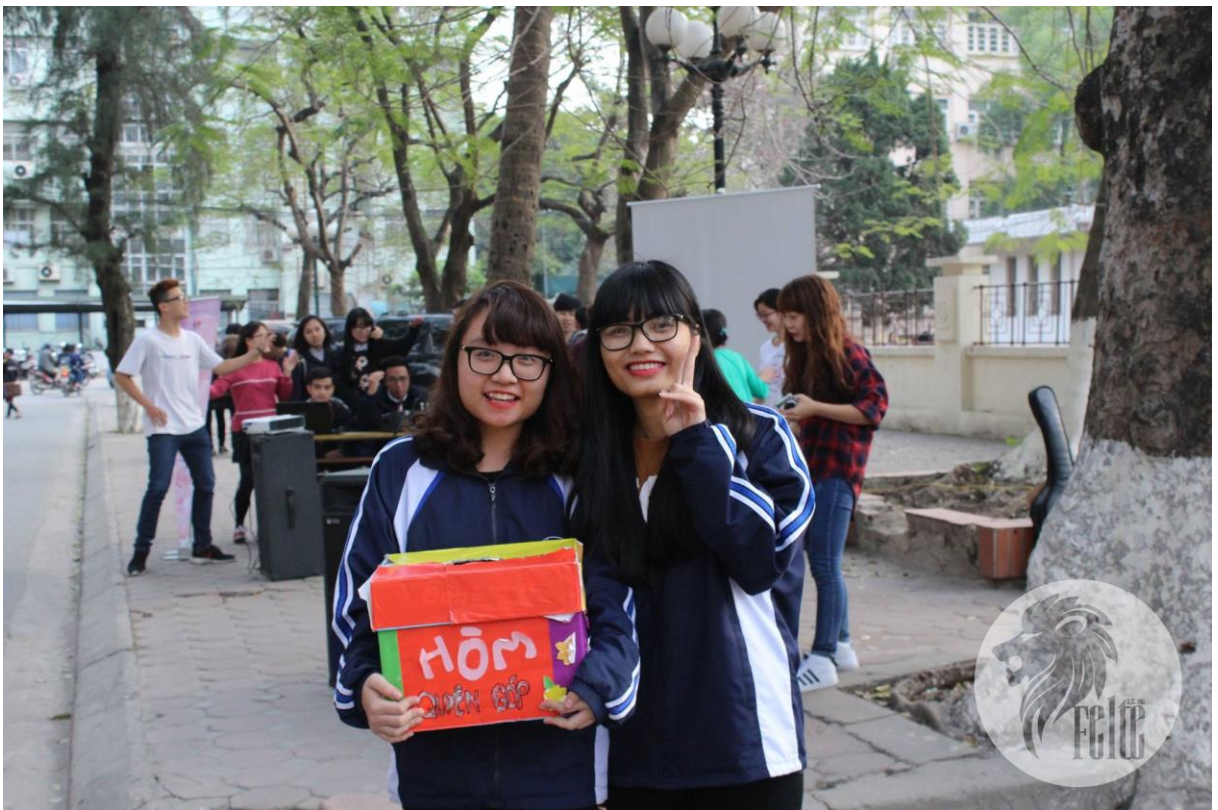
Sinh viên Khoa Sư phạm tiếng Anh tham gia hoạt động quên góp từ thiện.